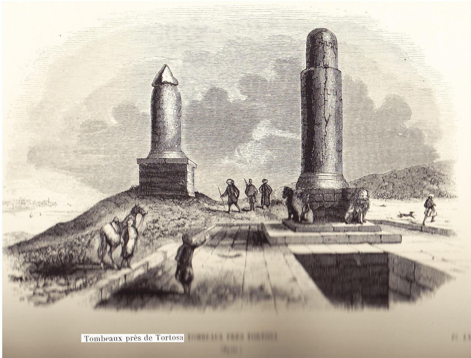
Tombeaux près de Tortosa